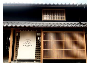
建物は約築150年 小坂酒造さんの長屋を改築した古民家オフィス。

※ワーケーションとは「ワーク」と「バケーション」を組み合わせた造語で観光地やリゾート地でテレワークを活用し、働きながら休暇をとる過ごし方