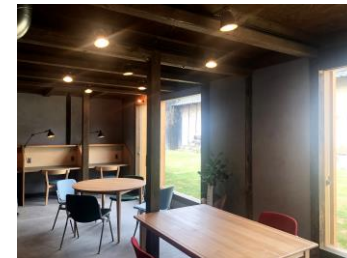
1階の coworking スペース。 その日の気分で好きな席で仕事ができます。